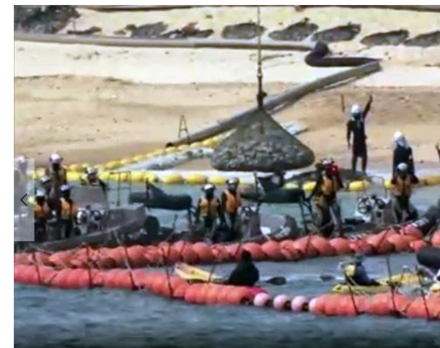
物々しい警備の中で実施！