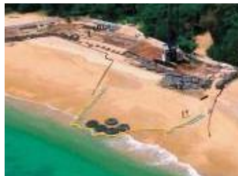
この日は5袋で終了(2017/04/25)