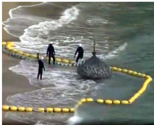
ネットに入った敷石の投入開始